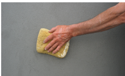
Execução do acabamento areado