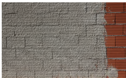
Preparação do suporte com Redur FIX