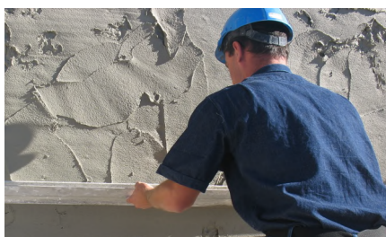
Aperto da argamassa com régua