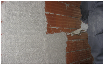
Aplicação por projecção