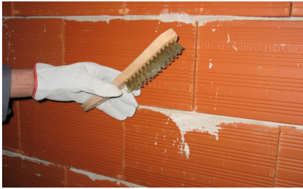
Preparação do suporte

REBOCO INTERIOR BRANCO PARA APLICAÇÃO PROJECTADA