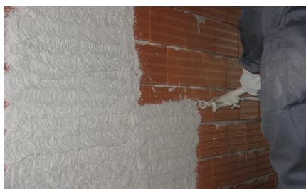
Aplicação por projecção