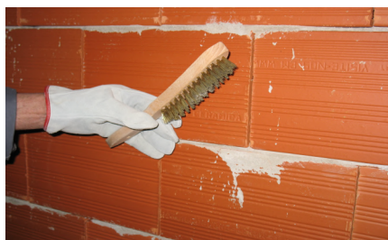
Preparação do suporte

REBOCO EXTERIOR BRANCO PARA APLICAÇÃO PROJECTADA