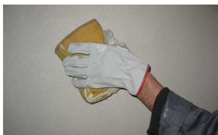
Execução do acabamento areado